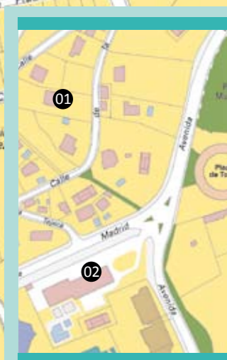
Continuación Avenida de Madrid