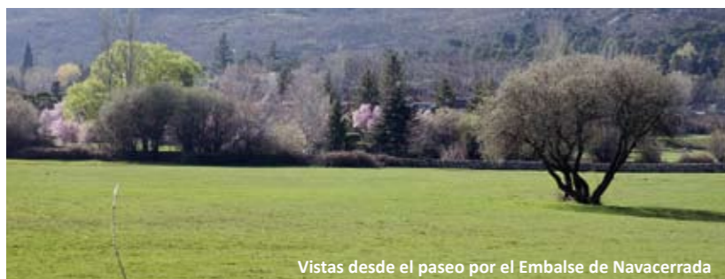
Vistas desde el paseo por el Embalse de Navacerrada

Madrid 10:00 a.m. en una de sus miles de oficinas, empresas, gabinetes... Un profesional de cualquier sector o actividad intenta mantener una reunión informativa o formativa, desarrollar un proyecto, una idea, y hacerla productiva. No es fácil, no se dan las condiciones adecuadas... A sólo 50 kms de allí por la autopista AP-6, en plena Sierra de Guadarrama y en un entorno relajado otro equipo de profesionales mantiene una ágil videoconferencia con Berlín, presenta su plan estratégico y forma a su gente mientras el olor de los pinos y la lavanda entra por la ventana con la montaña de fondo. Es Navacerrada.