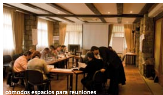
cómodos espacios para reuniones